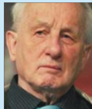
Rolf Hochhuth, Dramatiker: „Man wird Raucher nie ermorden, aber sie sind in zivilen Zeiten ganz brauchbar als eine gar nicht so kleine Gruppe von Sündenböcken.“