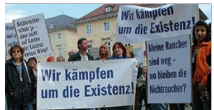
In Karlsruhe (Baden-Württemberg) gingen die Wirte auf die Straße und demonstrierten lautstark gegen das Verbot.

Je mehr Verbote, desto besser für Denunzianten. So kann jeder seine Machtgelüste und sadistischen Neigungen an Rauchern auslassen, wenn diese ihre Lustsucht an falscher Stelle treiben. Blockwartmentalität bekommt durch dicke Strafen und Bußgelder Rückenwind. Schon bietet die militante Anti-Raucher Organisation „pro Rauchfrei“ im Internet Vordrucke für die Denunziation an. Lichtblick: Der Widerstand der Wirte und der FDP. Es bleibt zu hoffen, dass die bis zu den Wahlen am Thema bleiben.