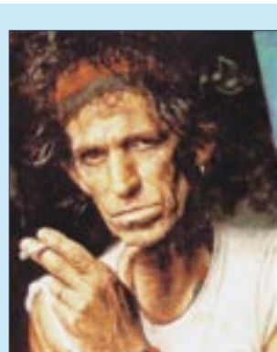
Keith Richards, Musiker: Raucht bei den Ausfahrten der Rolling Stones in letzter Zeit provokativ auf der Bühne: „Was soll der Scheiß mit den Rauchverboten.“