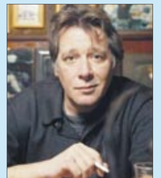
Jan Fedder, Schauspieler: „Früher gehörte die Zigarette einfach dazu, heute werden Raucher ausgegrenzt. Ich bin gegen Verbote und lassen mir die Kippe nicht verbieten.“