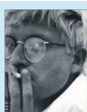
David Hockney, Maler: „Rauchen fördert meine geistige Gesundheit. Die beruhigende Wirkung ist mir allemal lieber, als die von pharmazeuthischen Produkten.“