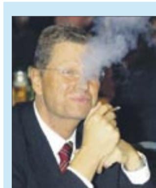
Guido Westerwelle (FDP): Schwul, mutig, tolerant: Unterstützt den liberalen Kurs der Wirte. „Wir sind für die Verfassungsklage: Überzeugungsarbeit statt Verbote.“

wirklich abhängig und erhöht tatsächlich sein Krebsrisiko, nicht zuletzt weil das Immunsystem und das psychische Wohlbefinden durch die ständige unterschwellige Angst beeinträchtigt werden. Es gibt Raucher, die sich dergestalt konditioniert haben, dass sie schon Lungenzwicken kriegen, sobald sie an eine Zigarette denken. Die geplanten Horrorbilder auf Zigarettenschachteln treiben es auf die Spitze.