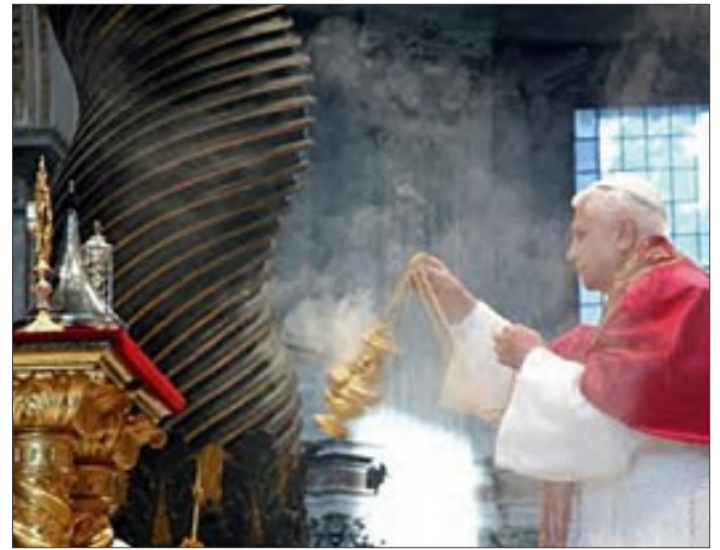
Übrigens: Die Feinstaubbelastung in Kirchen mit Kerzen und Weihrauch kann einer Studie zufolge zwischen 600 und 1.000 µg/m 3 Luft betragen, dem Durchschnittswert der Diskotheken.

Die vom ZDF genannte maximale Feinstaubbelastung in Diskotheken liegt bei weniger als der Hälfte des erlaubten Schichtmittelwertes und bei weniger als einem Viertel des erlaubten Spitzenwertes.