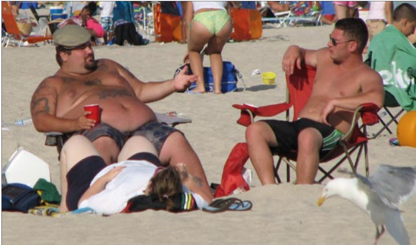
„Fit statt Fett“: So nennt Gesundheitsminister Horst Seehofer die neue Aktion der Bundesregierung.

Erst waren es die Raucher, die als Stinker, Vergifter, Schmarotzer, Asoziale ausgegrenzt wurden, nun trifft die Dicken das gleiche Schicksal. Das Ziel wechselt, die Waffen nicht. Es ist erstaunlich, aber andererseits logisch, dass die altbekannten Parolen, die gegen die Raucher so gute Dienste leisteten, völlig unverändert übernommen werden. Sie sind austauschbar. Primitivste Instinkte und Vorurteile werden ausgenutzt: „Die Unterschicht“, „die Ausländer“ und die „die Jugend“ essen, was das Zeug hält: nach Ansicht unserer selbsternannten Gesundheits- und Moralapostel natürlich zu fett, zu süß und zu viel. Schön, dass eine da ist, die für uns denken und uns lenken will: Super-Nanny für Erwachsene, der Gouvernantenstaat in Reinkultur, wie wir ihn aus Ami-Land kennen und lieben. Die Bundesregierung hat dementsprechend einen Plan mit dem herabwürdigenden Slogan „Fit statt Fett“ ins Leben gerufen. Der Verbraucherbevollmächtigungsminister Horst Seehofer ist