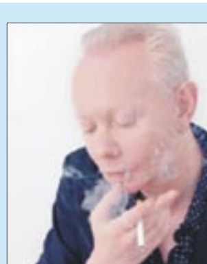
Joe Jackson, Musiker: „Die Antiraucherhysterie hat in USA und UK viel Schaden angerichtet. Rauchverbote sind böswillig, spalterisch, antidemokratisch und verlogen.“