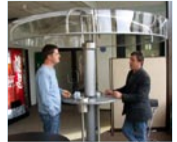
Dieser mobile Raucherschirm findet viele Freunde.

Technisch kein Problem: Luft wie im Operationsaal in Gaststätten... Die FDP in Schleswig-Holstein bringt die Sache auf den Punkt und fordert als Ergänzung zum Gesetzesentwurf Ausnahmen für Gaststätten mit guter Lüftungstechnik. Obwohl bis heute in keiner Kneipe oder Diskothek Grenzen überschritten wurden, so könnte man ohne Probleme die Luft noch besser machen - und Raucher und Nichtraucher könnten zusammensitzen. Das Angebot ist vielfältig von speziellen Lüftungsanlagen für Gaststätten bis zur mobilen Raucherinsel.