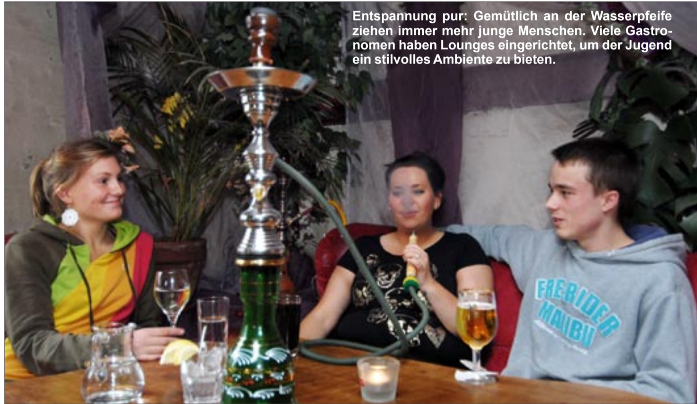
Entspannung pur: Gemütlich an der Wasserpfeife ziehen immer mehr junge Menschen. Viele Gastronomen haben Lounges eingerichtet, um der Jugend ein stilvolles Ambiente zu bieten.

Jugendliche betroffen: Verbot ist völlig unverständlich - Ritual für maßvollen Konsum