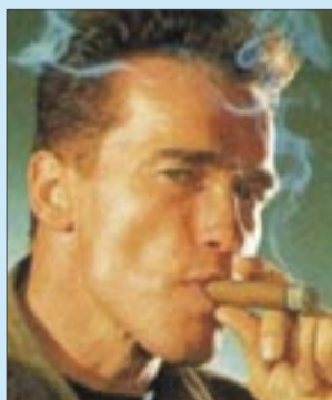
Arnold Schwarzenegger: Ließ hinter seinem Gouvernerspallast in Kalifornien ein Zelt als Raucherloge aufbauen: „Bei einer guten Zigarre kommen mir oft gute Ideen.“