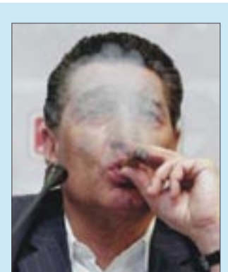
Rudi Assauer, Ex-Fußballmanager und Botschafter des kultivierten Rauchgenusses, genießt pro Tag bis zu fünf Zigarren: „Wo ich nicht rauchen darf, gehe ich nicht hin.“