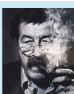
Günther Grass, Schriftsteller: „Wenn auf der nächsten Buchmesse ein totales Rauchverbot herrschen sollte, gehe ich da nicht mehr hin, denn ich brauche meine Pfeife.“